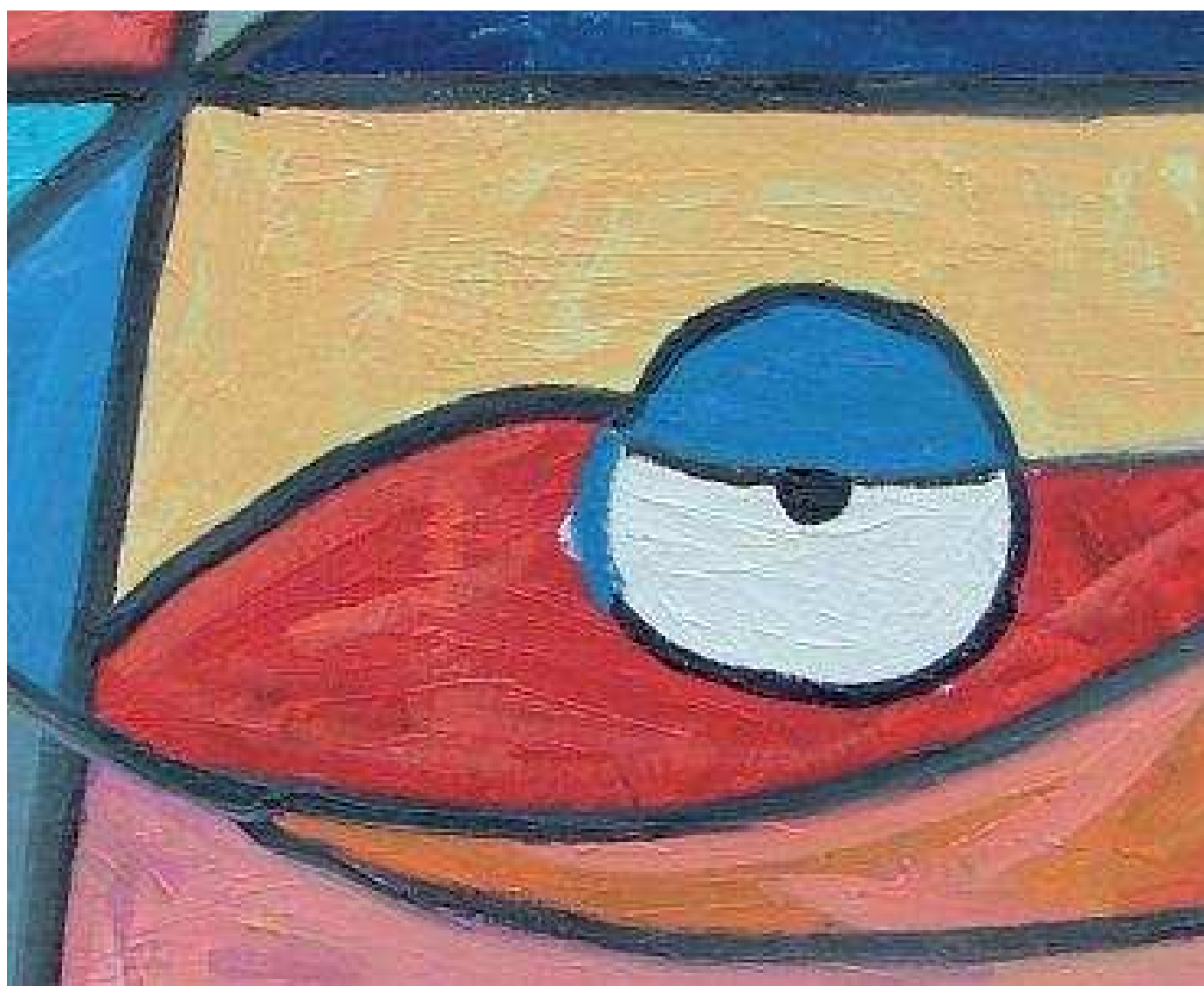
L.P., L'OCCHIO DEL PESCE